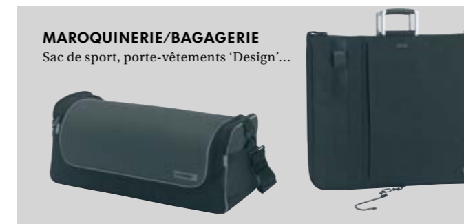
MAROQUINERIE/BAGAGERIE Sac de sport, porte-vêtements 'Design'...