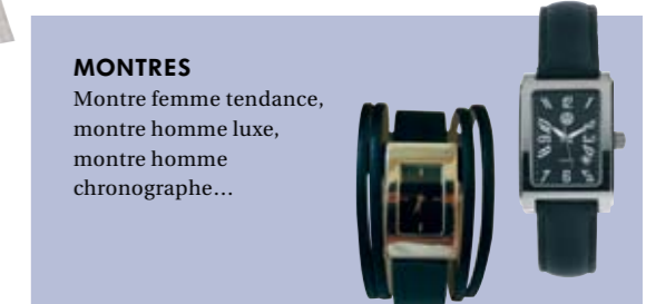
MONTRES Montre femme tendance, montre homme luxe, montre homme chronographe...