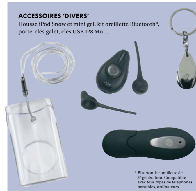
ACCESSOIRES 'DIVERS' Housse iPod Snow et mini gel, kit oreillette Bluetooth*, porte-clés galet, clés USB 128 Mo...