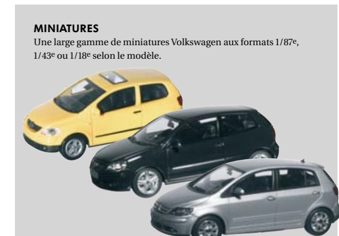
MINIATURES Une large gamme de miniatures Volkswagen aux formats 1/87 e , 1/43 e ou 1/18 e selon le modèle.