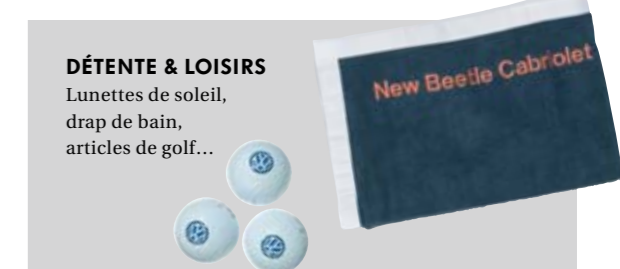
DÉTENTE & LOISIRS Lunettes de soleil, drap de bain, articles de golf...