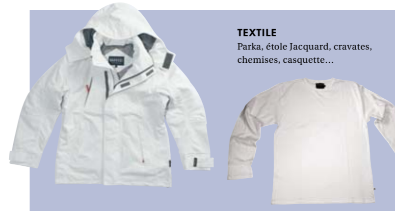
TEXTILE Parka, étole Jacquard, cravates, chemises, casquette...

Pour toute commande, rendez-vous chez le Partenaire Volkswagen le plus proche de chez vous.