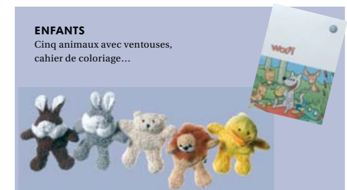
ENFANTS Cinq animaux avec ventouses, cahier de coloriage...

Si vous souhaitez de plus amples renseignements sur la collection, n'hésitez pas à contacter notre assistante de clientèle au 01 69 11 68 39.