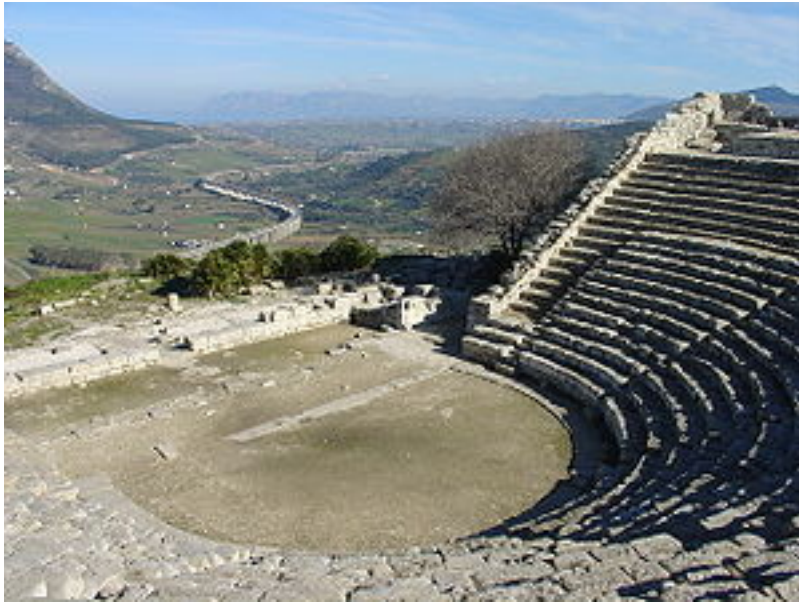
Le théâtre de Segeste.