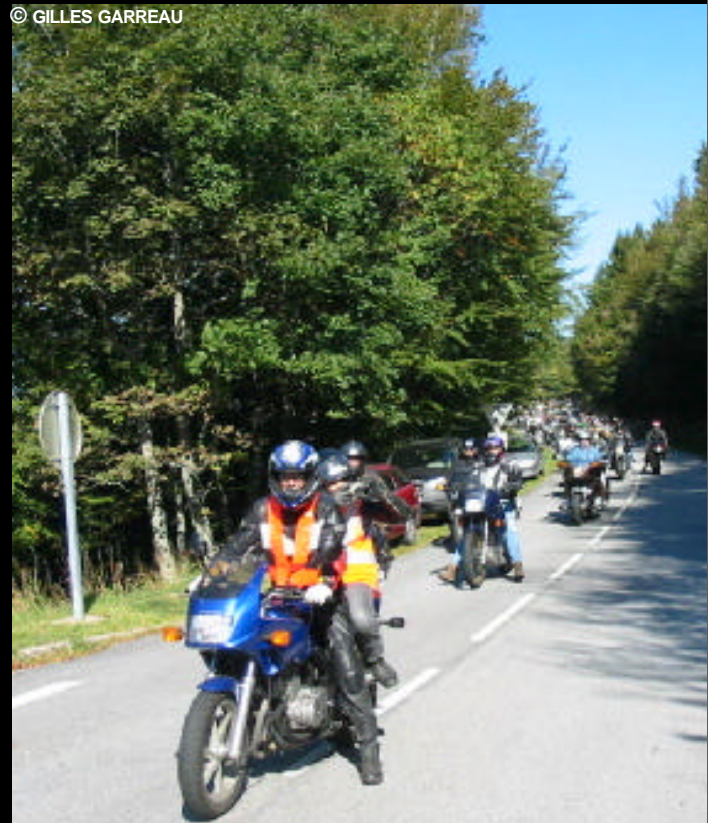
Une sécurité active a été mise en place