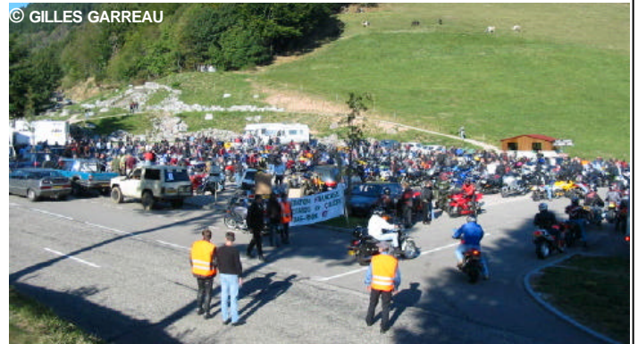
Les motos sont canalisées dès l'entrée du parking des Bagenelles