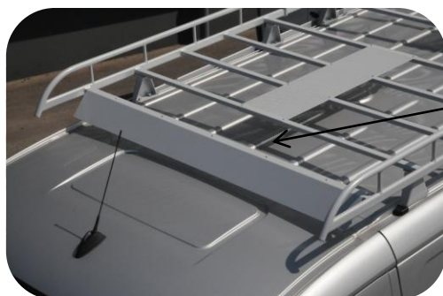
Défecteur d'air destiné à Atténuer les nuisances sonores

destiné à une meilleure répartition des charges sur les toits plats