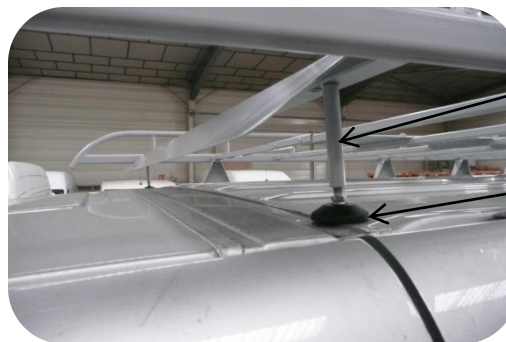
Entretoise + Pied articulé

destiné à une meilleure répartition des charges sur les toits plats