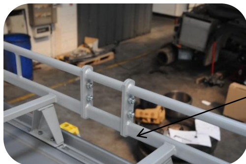
Centre court destiné à rallonger votre galerie