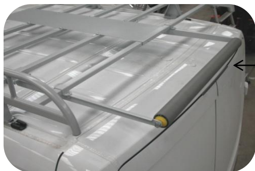
Rouleau de chargement en gomme antidérapante