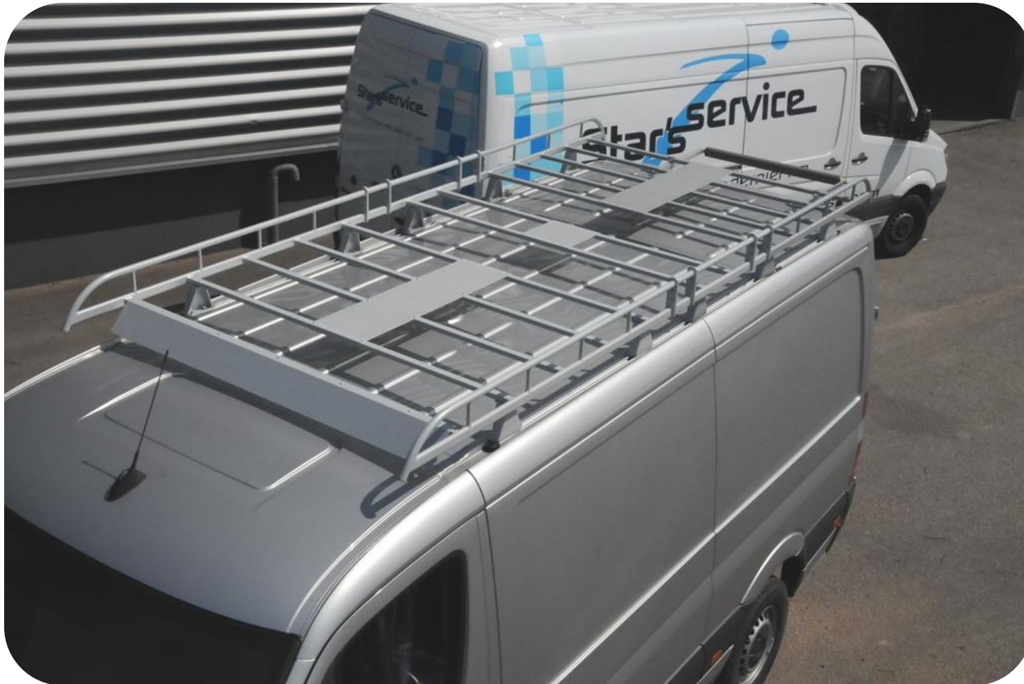
Galerie de toit sprinter 37N