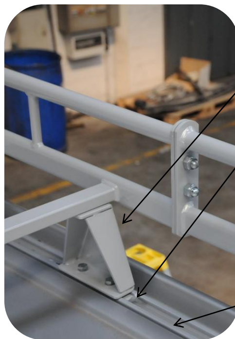
Equerre de fixation renforcée

Platine de guidage permettant la fixation des équerres dans les rails