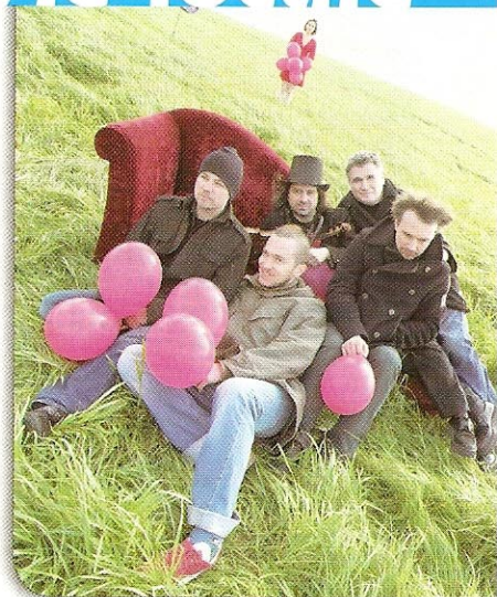
Les Mauvaises Langues seront au café Le Ménestrel.

Qu'importe le flacon, pourvu qu'on ait l'ivresse... de la Musique !!!