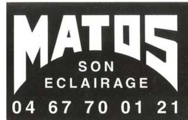
SARL MATOS Son / Eclairage