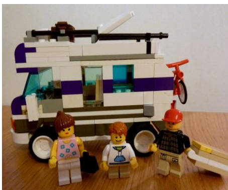
1- camping car Jouet&Co modèle 2010