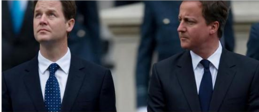
Nick Clegg et David Cameron