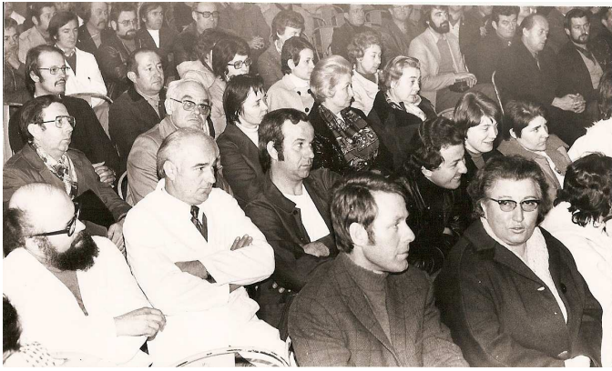
Soutien aux Postiers en grève 13 novembre 1974

« C'est le marché, et non l'Etat qui doit orienter les options principales. » 3