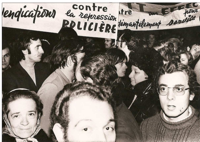
Contre les atteintes au droit de grève 20 novembre 1974