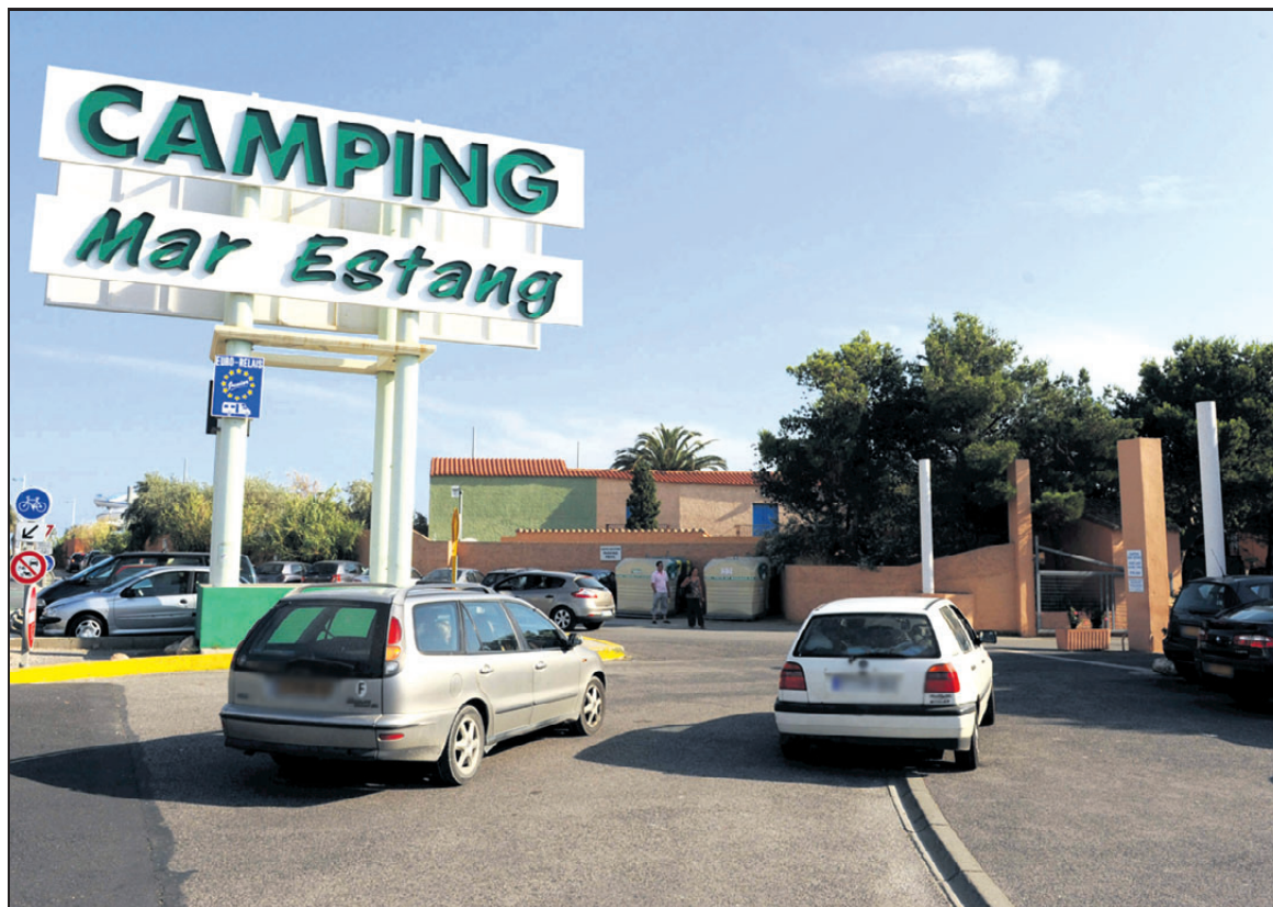
CANET-EN-ROUSSILLON (PYRÉNÉES-ORIENTALES), HIER. Six cas de grippe A ont été constatés dans ce camping.

Hier, les autorités préfectorales, les autorités sanitaires, médicales,