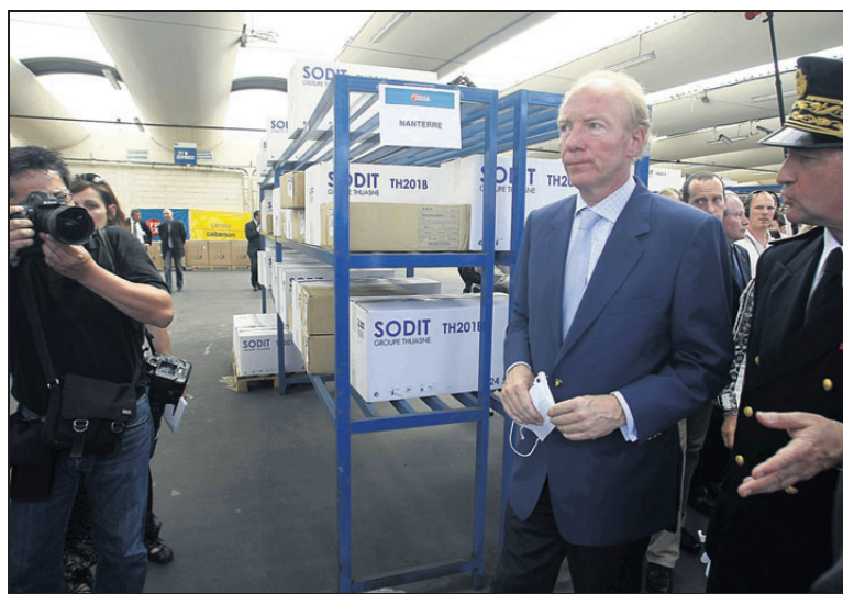
NANTERRE (HAUTS-DE-SEINE), HIER. Le ministre de l'Intérieur, Brice Hortefeux, a visité une plateforme de distribution de masques.

L E DÉPARTEMENT des Hauts-de-Seine se prépare activement à affronter un éventuel pic de grippe A à l'automne. Brice Hortefeux, le ministre de l'Intérieur, a pu s'en rendre compte, hier, lors d'un déplacement sur la plateforme de distribution de masques, à Nanterre, et au centre médical municipal de Suresnes. C'est le transporteur France Express qui a été choisi par l'Eprus (Établissement de préparation et de réponse aux urgences sanitaires) pour assurer l'acheminement des masques de protection vers les 36 centres communaux du département. Grâce à son rythme de deux livraisons quotidiennes, il sera capable de fournir près de 127 000 masques par jour en cas de pic. Le département est dès lors en train de constituer un « stock de sécurité » de 900 000 masques afin d'assurer un approvisionnement continu d'une semaine. Ce stock de