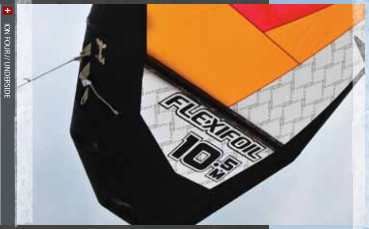
ION FOUR // UNDERSIDE