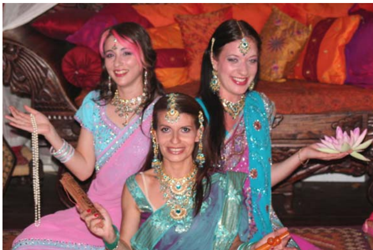
« Les Gayatri Devî »