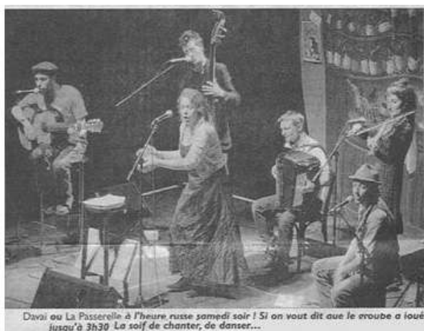
Davaï ou La Passerelle à l'heure russe samedi soir ! Si on veut dit que le vroube a foué jusqu'à 3h30. La soif de chanter, de danser...

« DAVAÏ ou La Passerelle à l'heure russe samedi soir ! Si on veut dit que le groupe a joué jusqu'à 3h30. La soif de chanter, de danser... »