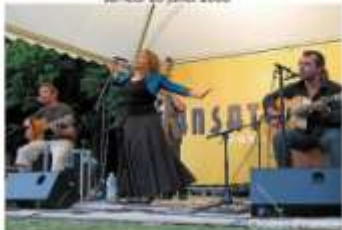
Transat en Ville - Davaï envoûte Maurepas - Rennes samedi 26 juillet 2008