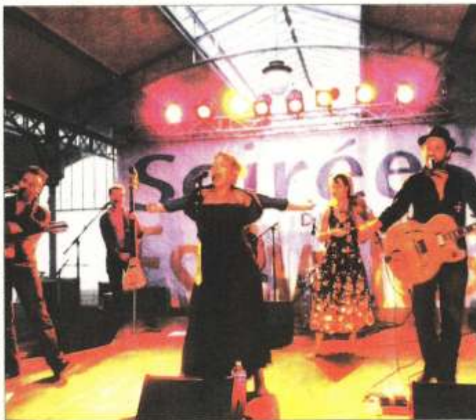
Chartres, vendredi. Dans le cadre des Soirées estivales, le groupe Davai a enthousiasmé le public de la place Billard.

Tous comptes faits, cette rencontre avec Davai a été un antidote de rêve contre la morosité.