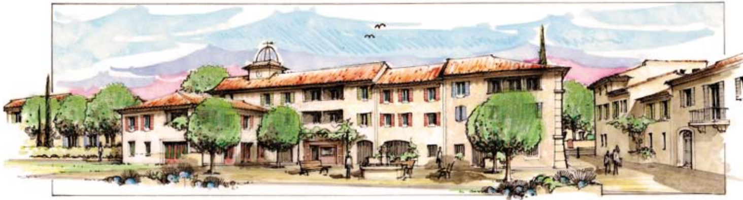
L'esprit de village est recréé par l'aménagement d'une placette au centre du hameau.