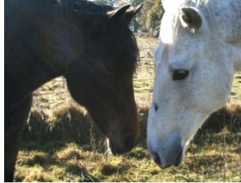
Tendre tête à tête