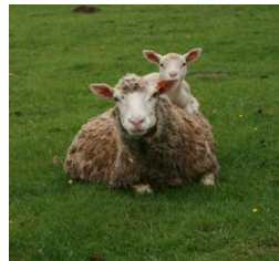
Brebis et son agneau