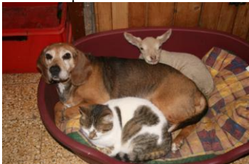
Le panier de l'amitié