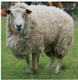
Mouton et prothèse en bois