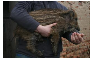
Marcassin sauvage, sauvé