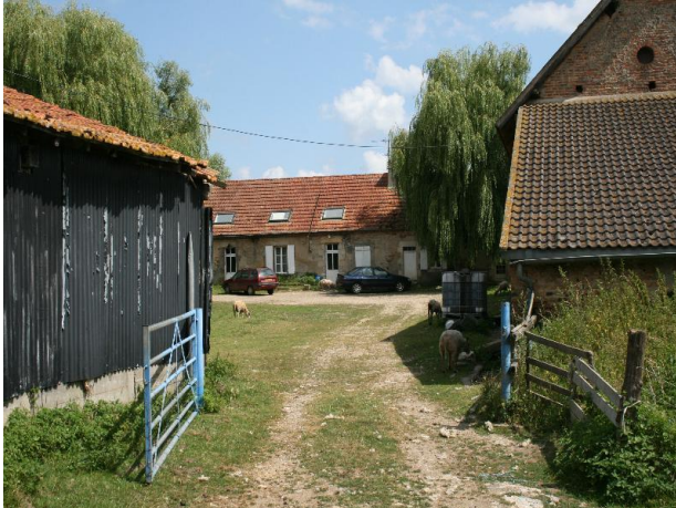
Bienvenue au Domaine des Douages