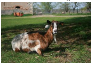
Bip Bip, la chèvre