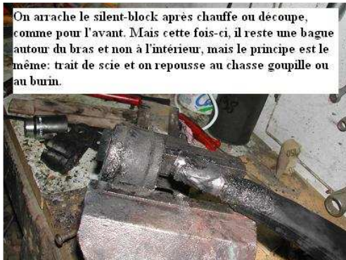
Trait de scie: