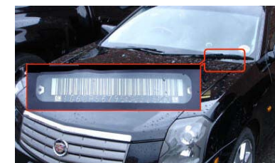
Drivers Side Door Jam