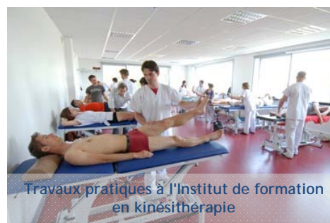
Travaux pratiques à l'Institut de formation en kinésithérapie

IFMKNF : Institut de Formation en masso-kinésithérapie