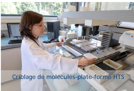
Criblage de molécules-plate-forme HTS

GENFIT : Société biopharmaceutique dédiée à la découverte et au développement de médicaments, notamment dans les domaines thérapeutiques liés aux désordres cardiométaboliques et neurodégénératifs.