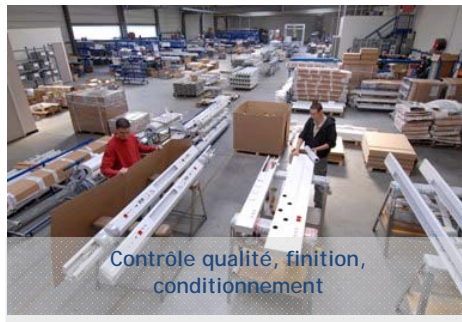
Contrôle qualité, finition, conditionnement