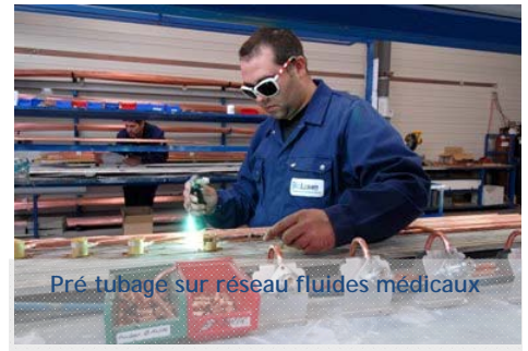
Pré tubage sur réseau fluides médicaux

GENFIT : Société biopharmaceutique dédiée à la découverte et au développement de médicaments, notamment dans les domaines thérapeutiques liés aux désordres cardiométaboliques et neurodégénératifs.