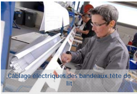
Câblage électriques des bandeaux tête de lit

BIOLUME : Développement et production de dispositifs médicaux : équipements et éclairages hospitaliers