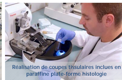
Réalisation de coupes tissulaires incluses en paraffine plate-forme histologie

IFMKNF : Institut de Formation en masso-kinésithérapie