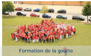
Formation de la goutte

> Pour donner votre sang, contacter la Maison du dong : 0820 80 22 22 - 38-42, av. Charles St Venant à Lille (à proximité de la gare Lille Flandres)