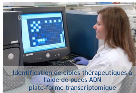
Identification de cibles thérapeutiques à l'aide de puces ADN plate-forme transcriptomique