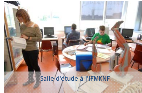
Salle d'étude à l'IFMKNF