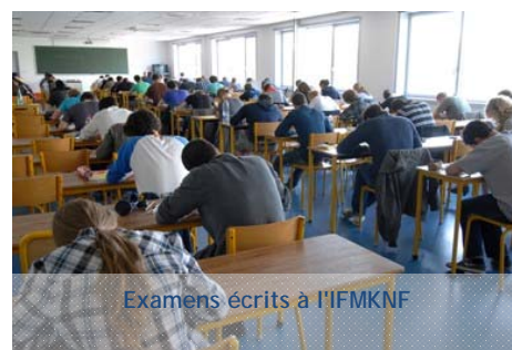
Examens écrits à l'IFMKNF