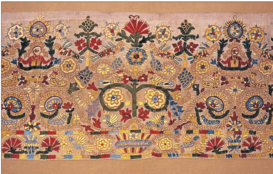
Fragment de robe. Crète, XVII e siècle.

Une exposition de la Fondation Boghossian