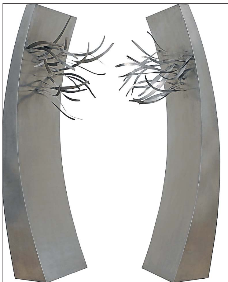
Pol Bury: «43 éléments se faisant face».

Un rêve d'éternité, à la Villa Empain (Bruxelles), jusqu'au 26 février. Infos: www.villaempain.com