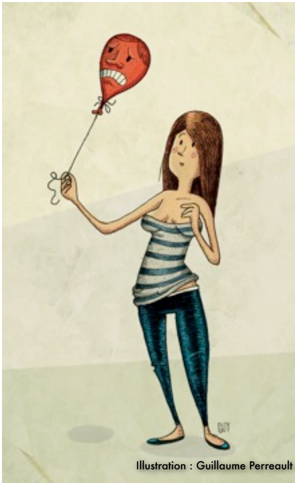
Illustration : Guillaume Perreault