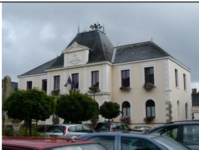
Place de la Mairie