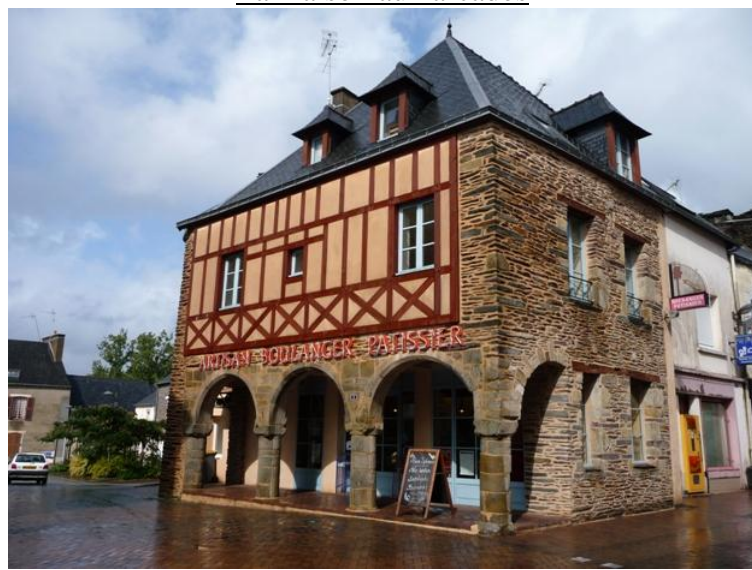
La maison aux arcades