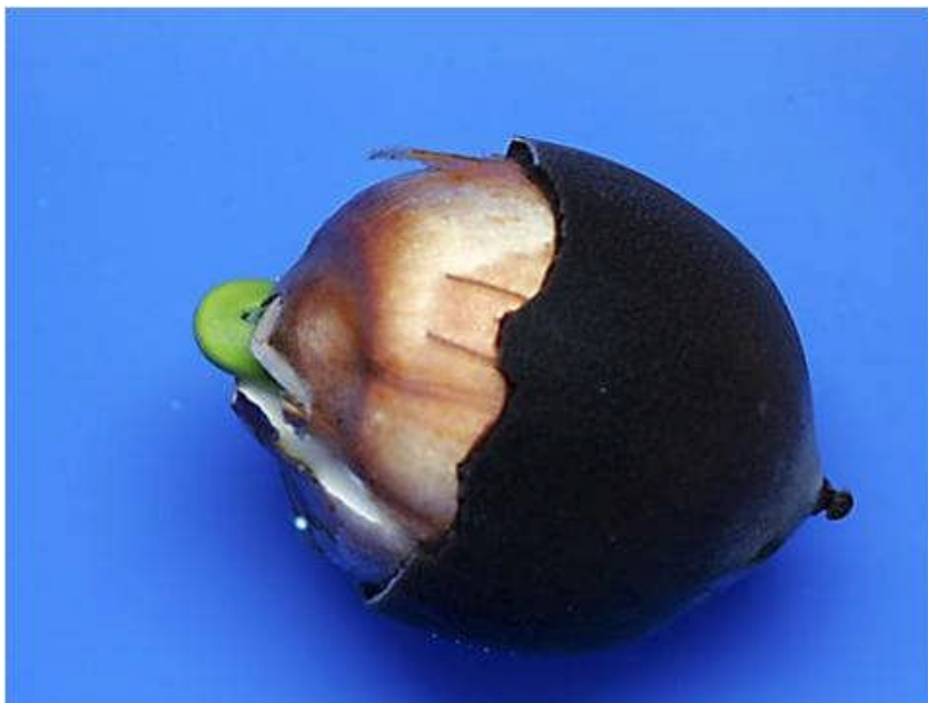
Bourgeon après 1 jour