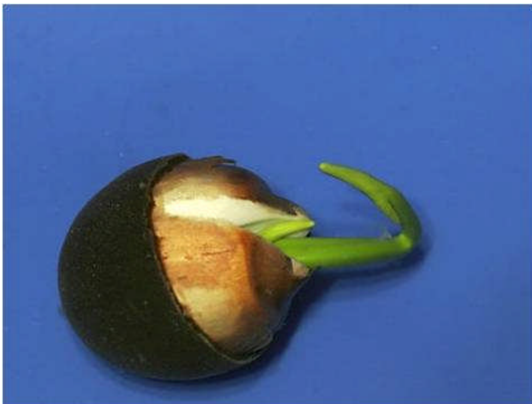
Bourgeon après 1 semaine (2 feuilles sont déjà visibles)