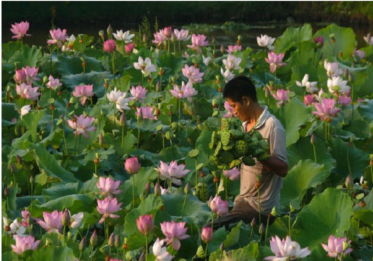
Ramassage des graines de Lotus en Chine chez notre producteur