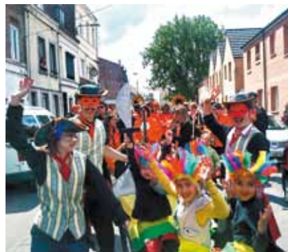
"Caté vacances" Février 2012