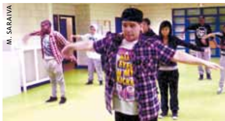
Le hip-hop est une discipline qui permet aux danseurs de s'affirmer.

Pour faire du hip-hop, on devait sortir du quartier. Et ce n'est pas forcément évident de sortir du quartier quand on a 15 ou 16 ans : pour moi, par exemple, ça a été difficile de continuer la danse à cause de cela. En plus, le prix des cours et de l'inscription est souvent exorbitant. Mon projet est donc aussi d'offrir des cours à des prix abordables. Je suis absolument contre le fait que cette discipline, qui à la