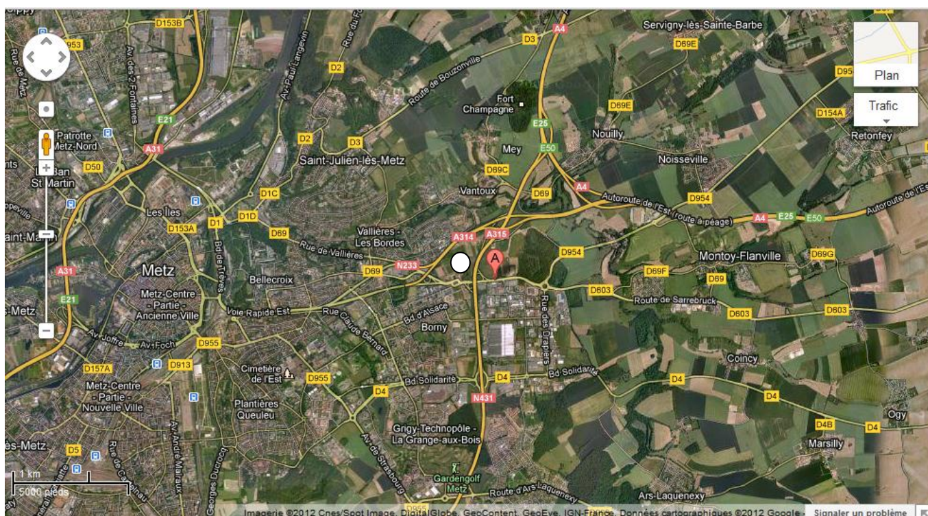
Vue du complexe sportif des hauts de blémont à l'est de la ville