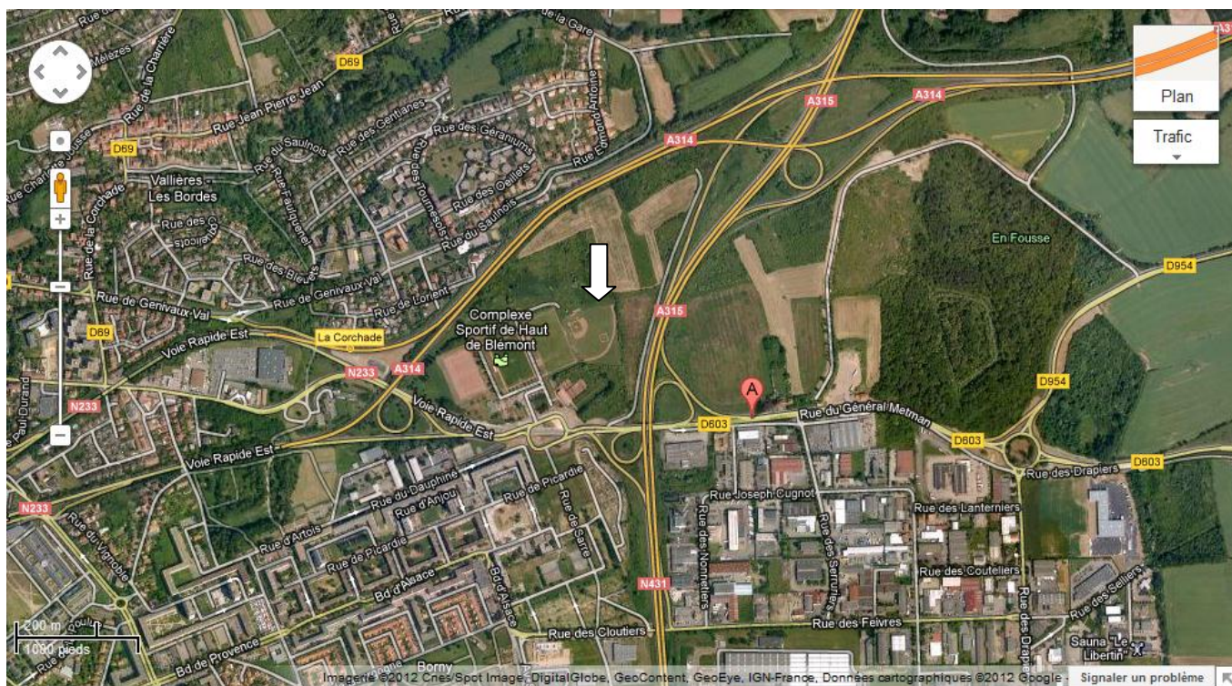
Vue du terrain au niveau du complexe sportif des hauts de blémont