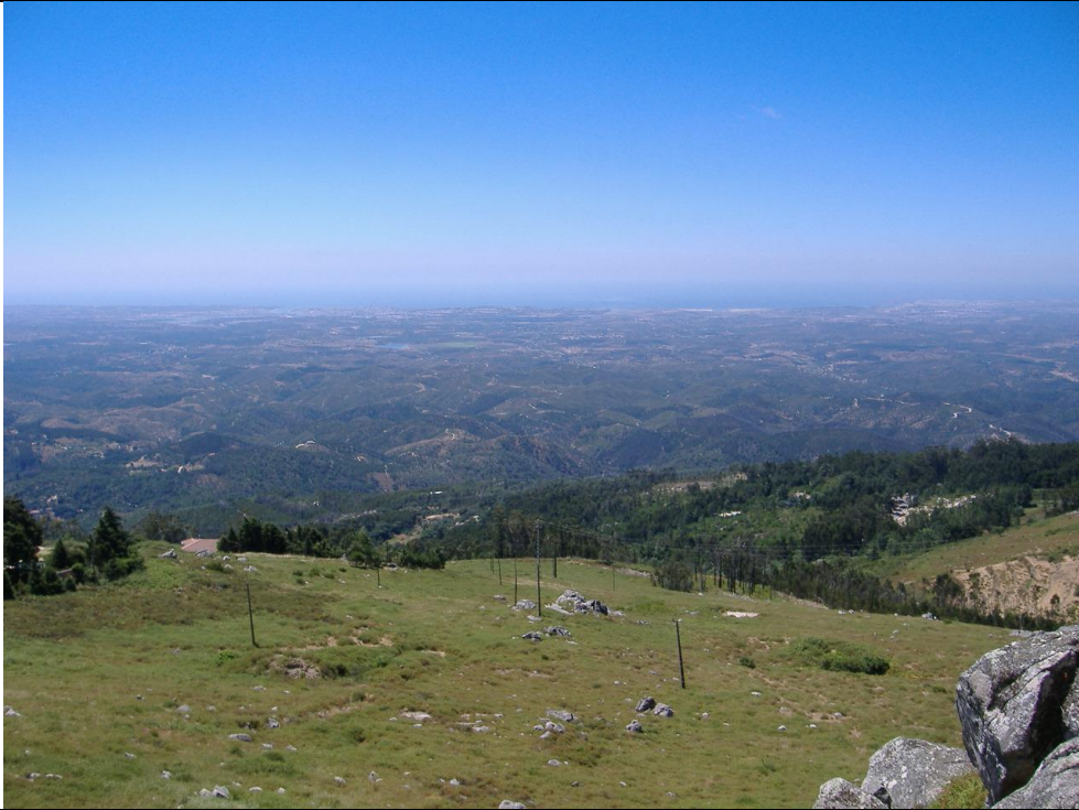
Moinho da Rocha