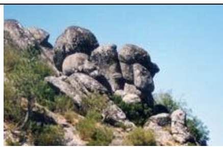
Cabeça do Velho

Le Mondego, le plus long des fleuves entièrement portugais prend sa source (signalée) à 1.360 m d'altitude. La route passe le long de la Pousada de Sao Lourenço d'où s'offre un beau point de vue sur Manteigas et la vallée du Zêzere en face. C'est ensuite la descente brutale en lacet sur la haute vallée du Zêzere : un belvédère aménagé offre bientôt une vue d'enfilade sur l'amont de la vallée que contrôle Manteigas.