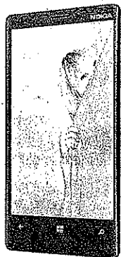
Le Nokia Lumia 920.