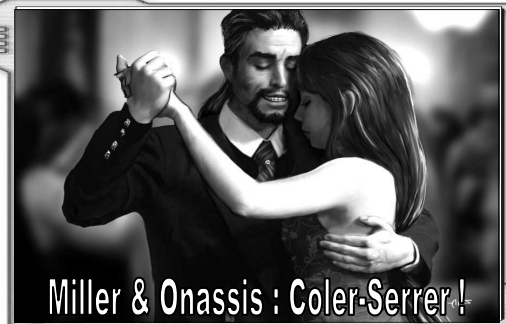
Miller & Onassis : Coler-Serrer !