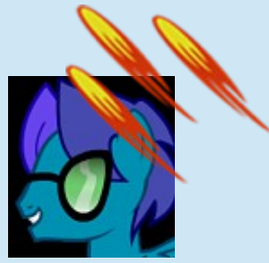
Pégasus Génius « L'Éclaireur »