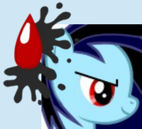
Skyeril « Le Docteur »