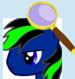
Ardama « L'Informateur »