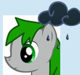
Grumpy Green « Le Scribe »

« Une étude qu'un simple ne comprend pas, est une mauvaise étude » Grumpy Green