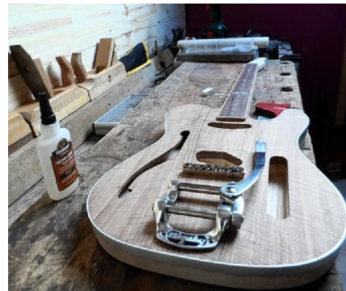
Attention, chantier en cours ! Une centaine d'heures seront nécessaires à la fabrication de cette guitare électrique.

On s'en sera douté, ce soin particulier apporté à l'objet se répercute dans le prix, de 1800 à