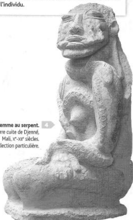
4 Femme au serpent. Terre cuite de Djenné, Mali, x e -xii e siècles. Collection particulière.