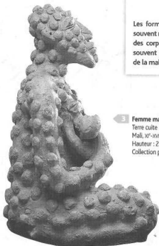
3 Femme malade. Terre cuite de Djenné, Mali, x e -xvi e siècles. Hauteur : 26,8 cm. Collection particulière.

Les formes varient avec les thèmes. Si les statues de puissants sont souvent rigides, pour inspirer le respect, les autres montrent une souplesse des corps : corps accroupis, déformés par la maladie. Le serpent est souvent présent, symbole tantôt de fécondité ou d'immortalité, tantôt de la maladie qui ronge l'individu.