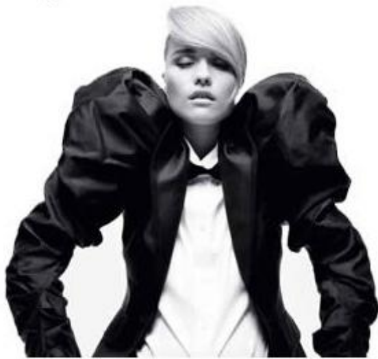
Ceci est une manche gigot.

La manche gigot est, par définition, une manche dont la forme est bouffante dans la partie supérieure (au-dessus du coude), et moulante sur l'avant bras. Cette forme est due à un habile jeu de plis ou de fronces au niveau de la tête de manche (= la partie qui est raccordée à l'épaule).