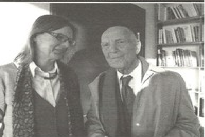
Siv Bublitz, la patronne d'Ullstein à Berlin, avec Stéphane Hessel