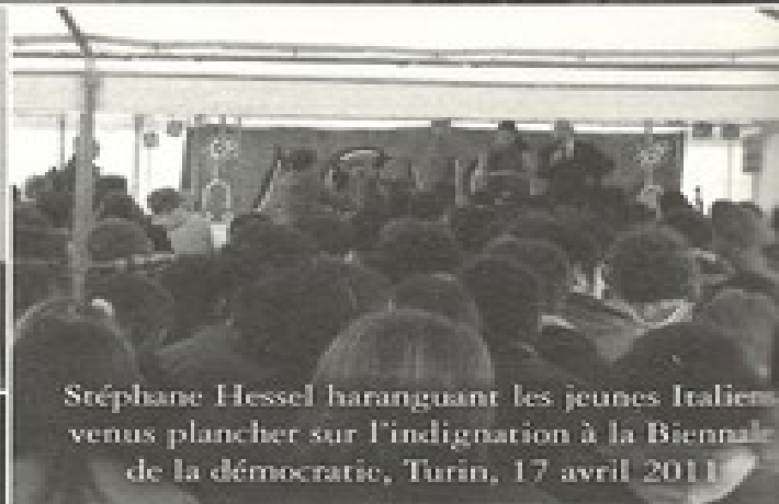
Stéphane Hessel haranguant les jeunes Italiens venus plancher sur l'indignation à la Biennale de la démocratie, Turin, 17 avril 2011