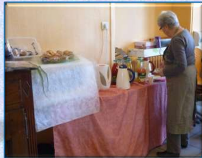
Espace de convivialité