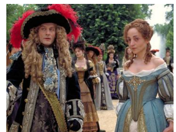
L'allé du roi