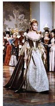
Angélique Marquise des Anges