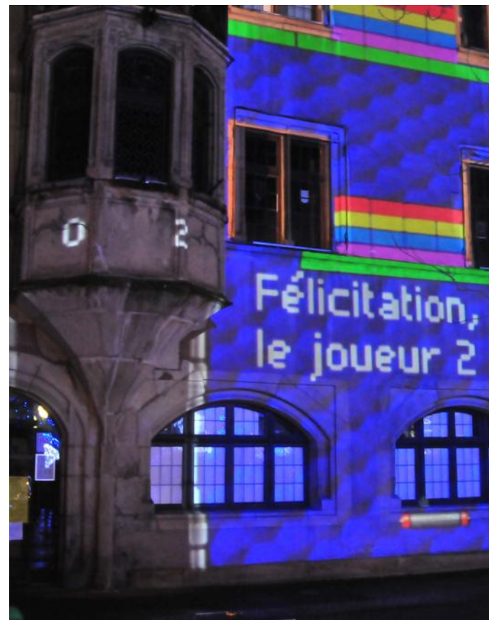
La mairie, un grand terrain de jeu pour le technicien.

De Noël bleu, il garde le souvenir d'une « liberté de pensée », au sein d'une relation riche