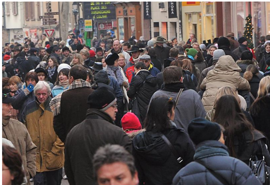
les magasins du centre-ville seront ouverts ce dimanche 9 décembre.