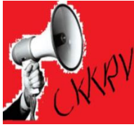
Collectif Kourouciens Kourouciennes, Réveillez-vous !