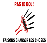
Ras Le Bol