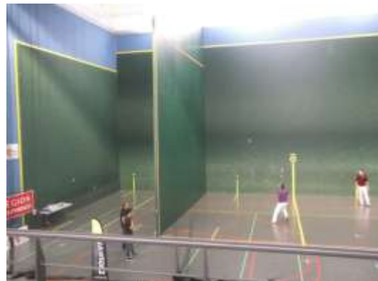
Parede móvel em uso