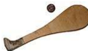
Paleta peso 600g

Modalidade de jogo masculina, que se joga num campo de parede esquerda com comprimento de 36 metros. Joga-se com uma raquete de madeira (paleta) e uma pelota de pele. A velocidade de jogo pode ir de 250 à 280 km/h, razão pela qual é obrigatório o uso de óculos de proteção e capacete.