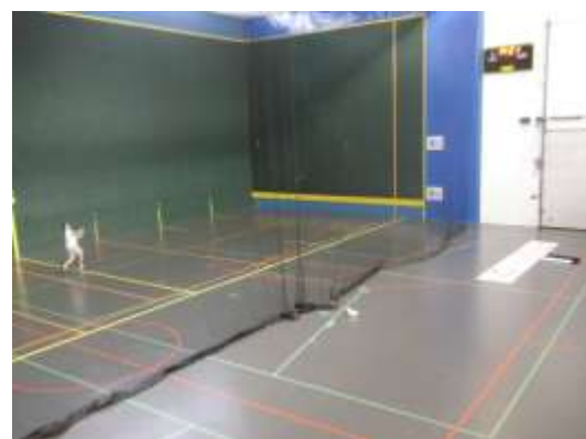
Campo para pelota basca, basquete, futsal, handebol, badmington, voleibol

A visão, a sensação e a perceção são sentidos que nos faz gostar de uma atividade. Por essa razão o tamanho do espaço de jogo é importante, porque vai também permitir de colocar em desafio as qualidades técnicas e físicas de cada praticante ou jogador.