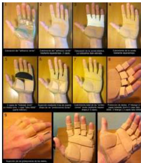
Protecção de mãos

Esta em criação uma luva própria para a protecção das mãos de modo a simplificar todo o processo de preparação do atleta para o jogo.