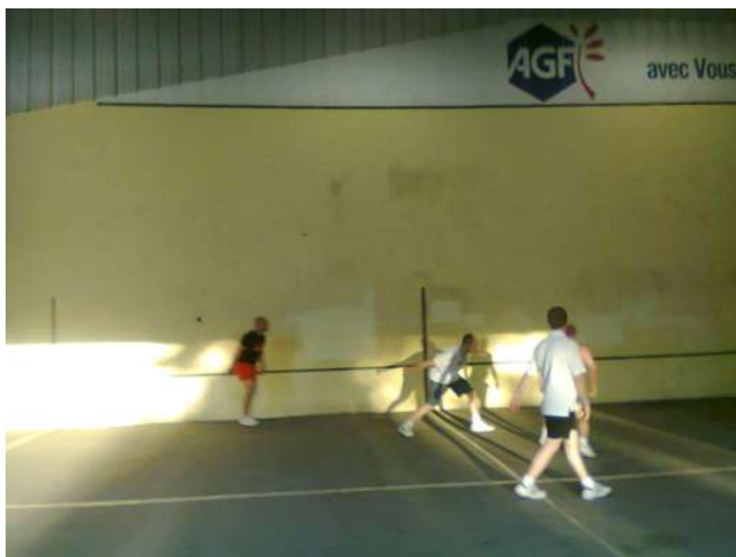
Campo "Parede Esquerda" coberta