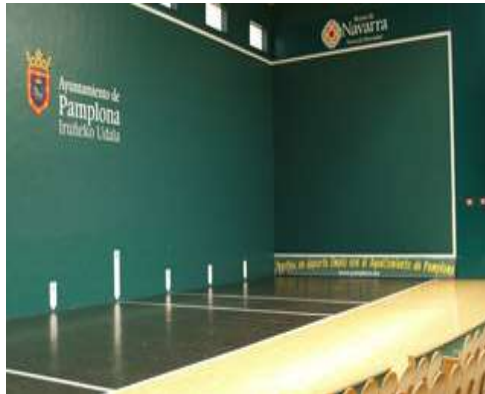
Campo parede esquerda

Modalidade de jogo feminina e masculina, que se joga num campo de parede esquerda de um comprimento de 30 metros com uma raquete de ténis e uma bola de borracha (mais pequena que a bola de ténis). Devido a rapidez de jogo em cada partida é obrigatório o uso de óculos de proteção.