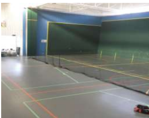
Parede móvel arrumada