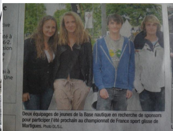
Deux équipages de jeunes de la Base nautique en recherche de sponsors pour participer l'été prochain au championnat de France sport glisse de Martigues.