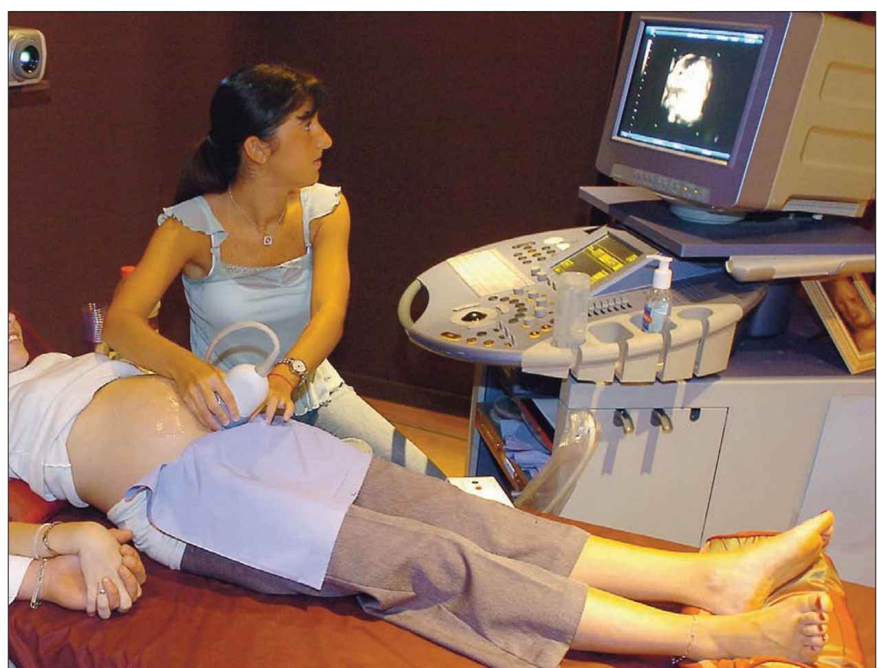
L'avortement est une épreuve difficile à surmonter pour un couple.