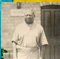
Simon KIMBANGU (1887 - 1953)