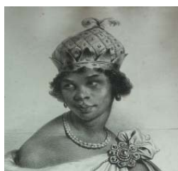
Reine NZINGA (1582 - 1664)