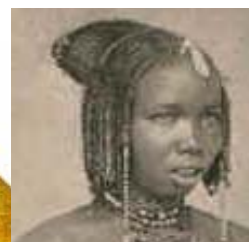
Ndona KIMPA VITA (1682 - 1706)