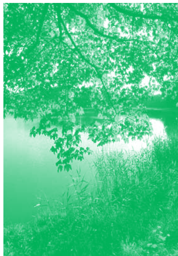
Sanglier à Belval