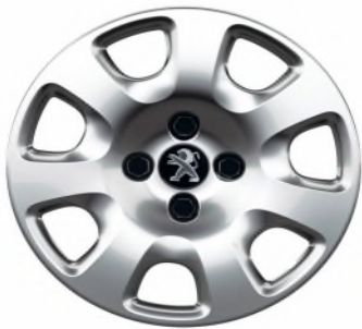
Enjoliveur Atacama 15"