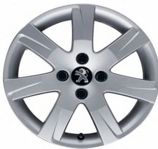
Jante alliage Santiaguito 2. 16"