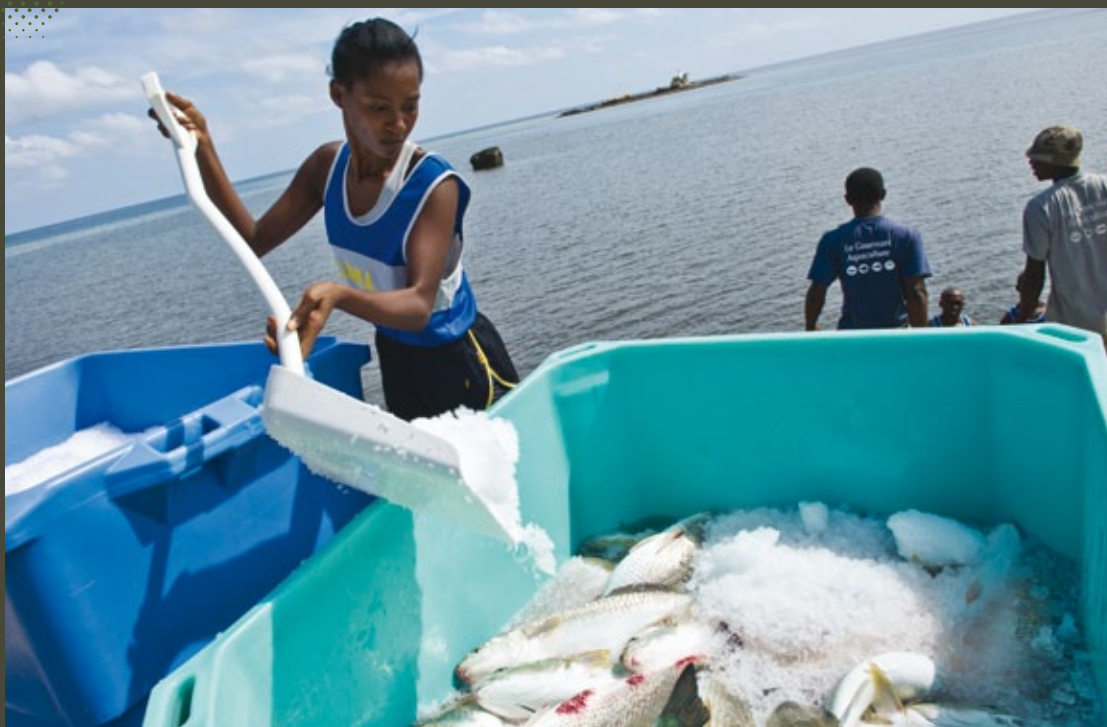
Filière pisciculture du groupement du SMA à Mayotte.