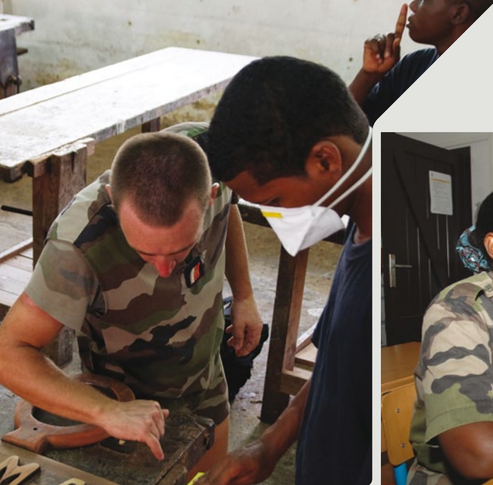
Précision et rigueur sont des valeurs enseignées à Saint-Jean-du-Maroni.