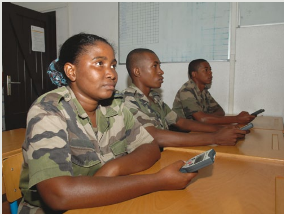
En Guadeloupe, comme dans les autres territoires ultramarins, l'obtention du permis B est un atout pour les jeunes.

en perte de vitesse dans la société civile contemporaine. Si cette culture militaire n'est pas toujours partagée par les acteurs civils, le cadre du SMA, lui, devra faire preuve de pédagogie, d'ouverture d'esprit et d'initiative afin de réaliser sa mission au service de la jeunesse des Outre-mer français.