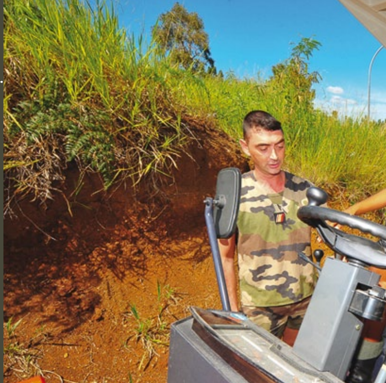
Encadré au plus près, chaque bénéficiaire prend confiance en ses capacités.

Le service militaire adapté (SMA) est un dispositif militaire d'insertion socioprofessionnelle destiné aux jeunes de 18 à 25 ans, éloignés du marché de l'emploi au sein des Outre-mer français.