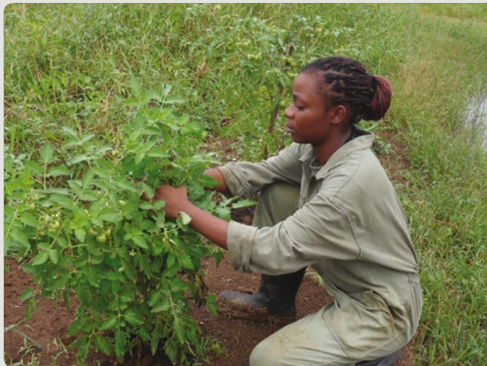
L'horticulture est l'une des formations dispensées au RSMA de Guyane.