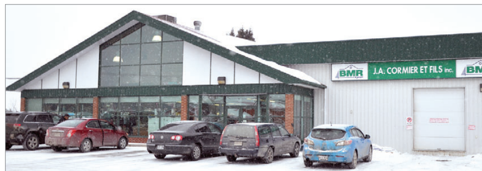
Le BMR J. Albert Cormier et Fils Inc. acquiert le magasin Quincaillerie Ace de Maria.

Grâce à cette acquisition, l'entreprise espère desservir encore mieux le territoire de Maria en offrant de nouveaux services à sa clientèle et elle est très heureuse de s'adjoindre l'expertise de l'équipe de Maria pour y arriver.