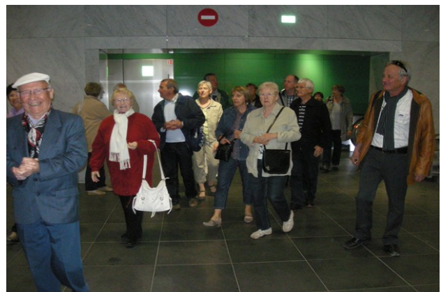
....l'essentiel est d'arriver à bon port.