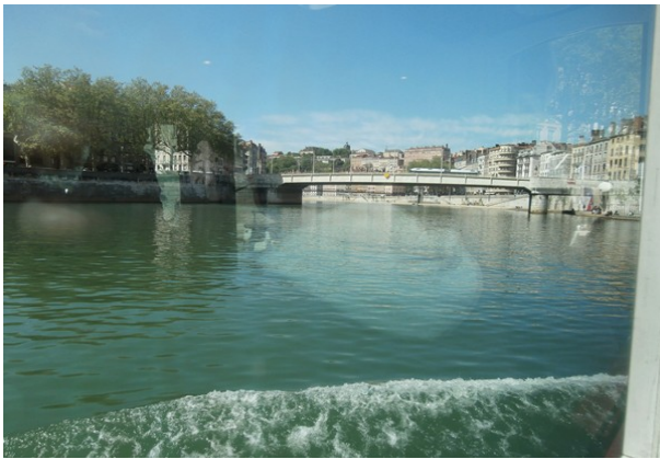
Belle mais courte croisière à bord du Vaporetto ....