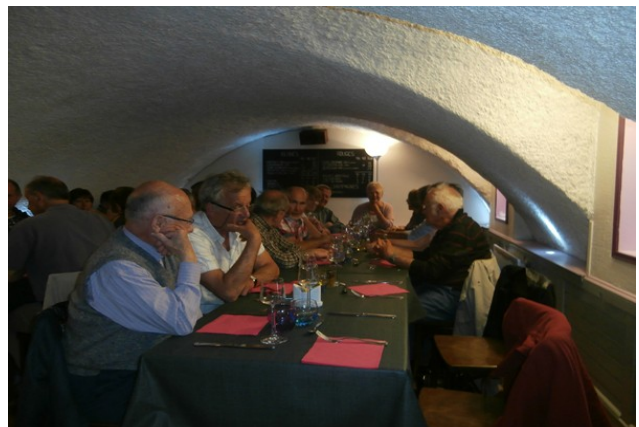
Cette fois-ci c'est la pause et le réconfort.