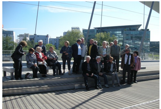
Un moment pour la pose, sur le pont Raymond Barre.