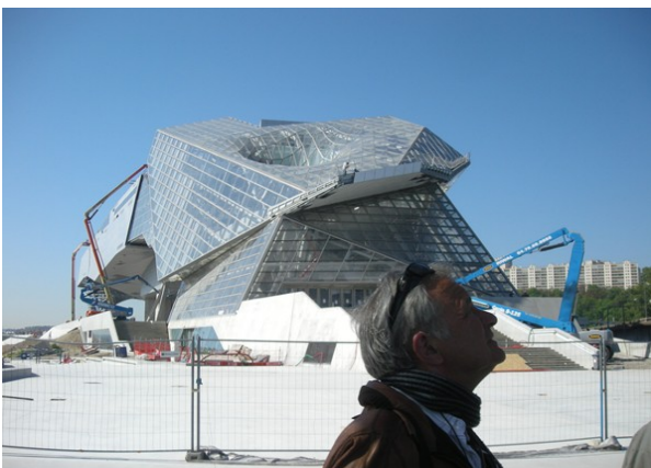
Eblouissement par le futurisme d'un amateur...pourtant éclairé.