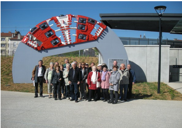
Terminus B à Oullins au pied de la roue de coupe du tunnelier.

Une sortie lyonnaise réussie... Le beau temps était au rendez-vous ainsi que trente d'entre nous pour un parcours entre Oullins, provisoire terminus de la ligne B du métro (qui doit poursuivre jusqu'à l'hôpital de Lyon-Sud), la Confluence, Perrache, le quartier de St Paul à St Jean et Fourvière.