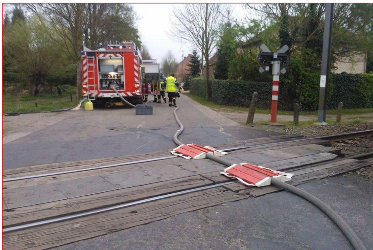
Les Sapeurs...ça fait peur, (parfois).