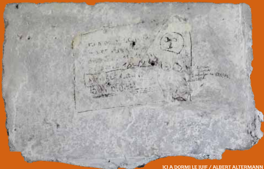
ICI A DORMI LE JUIF / ALBERT ALTERMANN / DRANCY LE 11-12-[19]43 (...), Graffiti sur carreau de plâtre formant contre-cloison. Arch. nat., AE/VI/16.