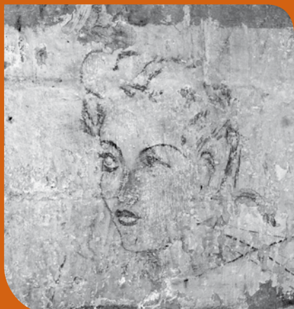
Graffiti dans la casemate n° 17 du fort de Romainville représentant un visage.