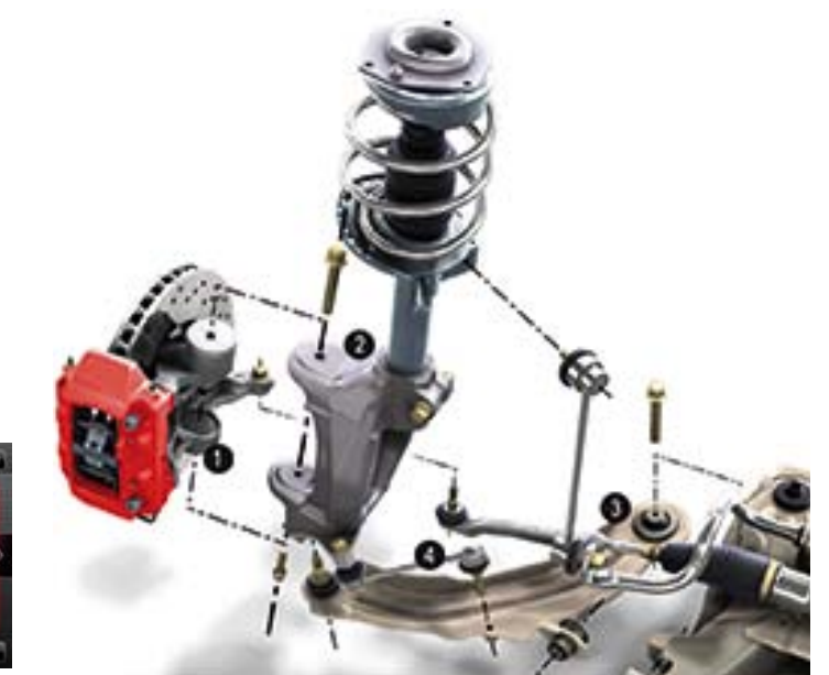
1. Radnabe. 2. Federbein. 3. Unterer Querlenker. 4. Anti-Rotationsstab.