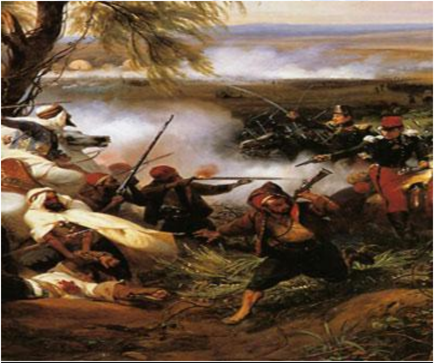
Scène de bataille entre soldats français et résistants algériens

Rapporté par M. BENBRAHIM dans Femmes du Maghreb , 9/99