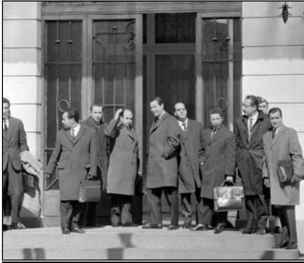
Délégation du GPRC aux négociations d'Evian