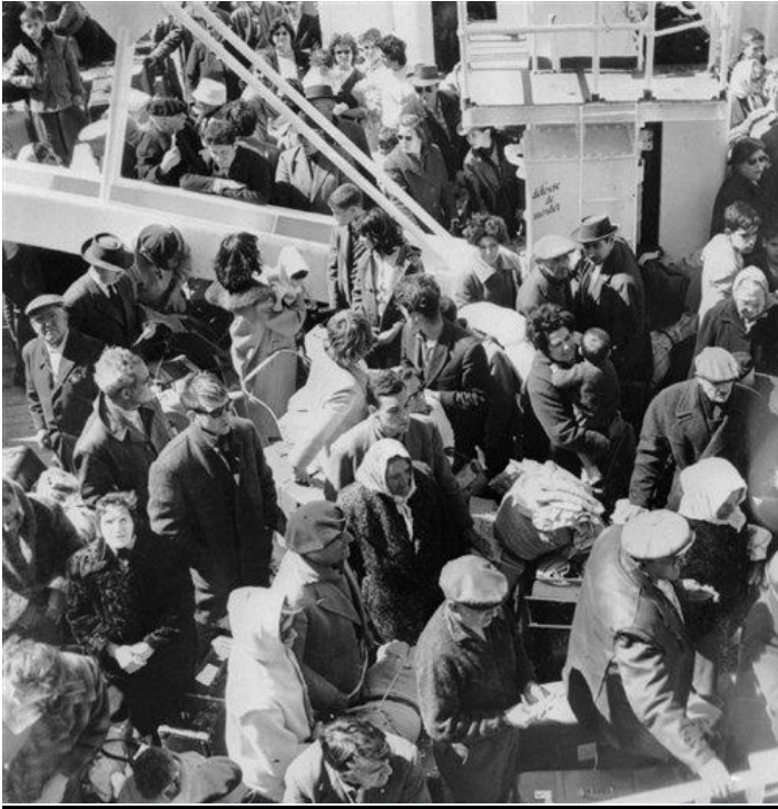
Départ des Européens après le proclamation de l'indépendance