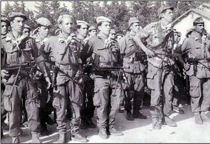
Groupe de combattants de l'ALN