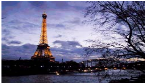
AAA TRANSWORD à Paris

Un demi-siècle d'expérience pour une VISION de l'AVENIR en PARTENARIAT avec des clients prestigieux, exigeants :