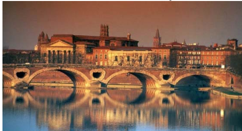
Abc TRANSWORD à Toulouse