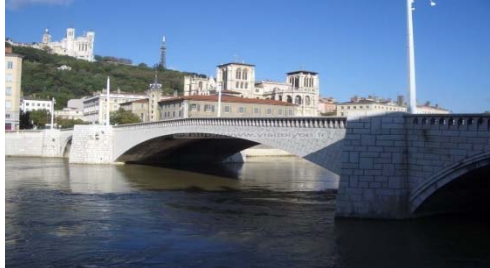
ATi TRANSWORD à Lyon