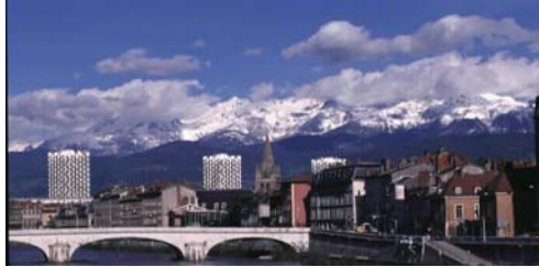
ATi TRANSWORD à Grenoble