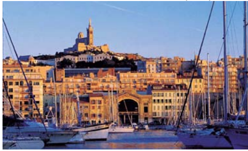
Am TRANSWORD & T.E.E.T. à Marseille

46 e année du groupe AAA-TRANSWORD-T.E.E.T. fondé en 1966 avec T.E.E.T. du rachat de S.E.A.T. Traduction Marseille (1959)